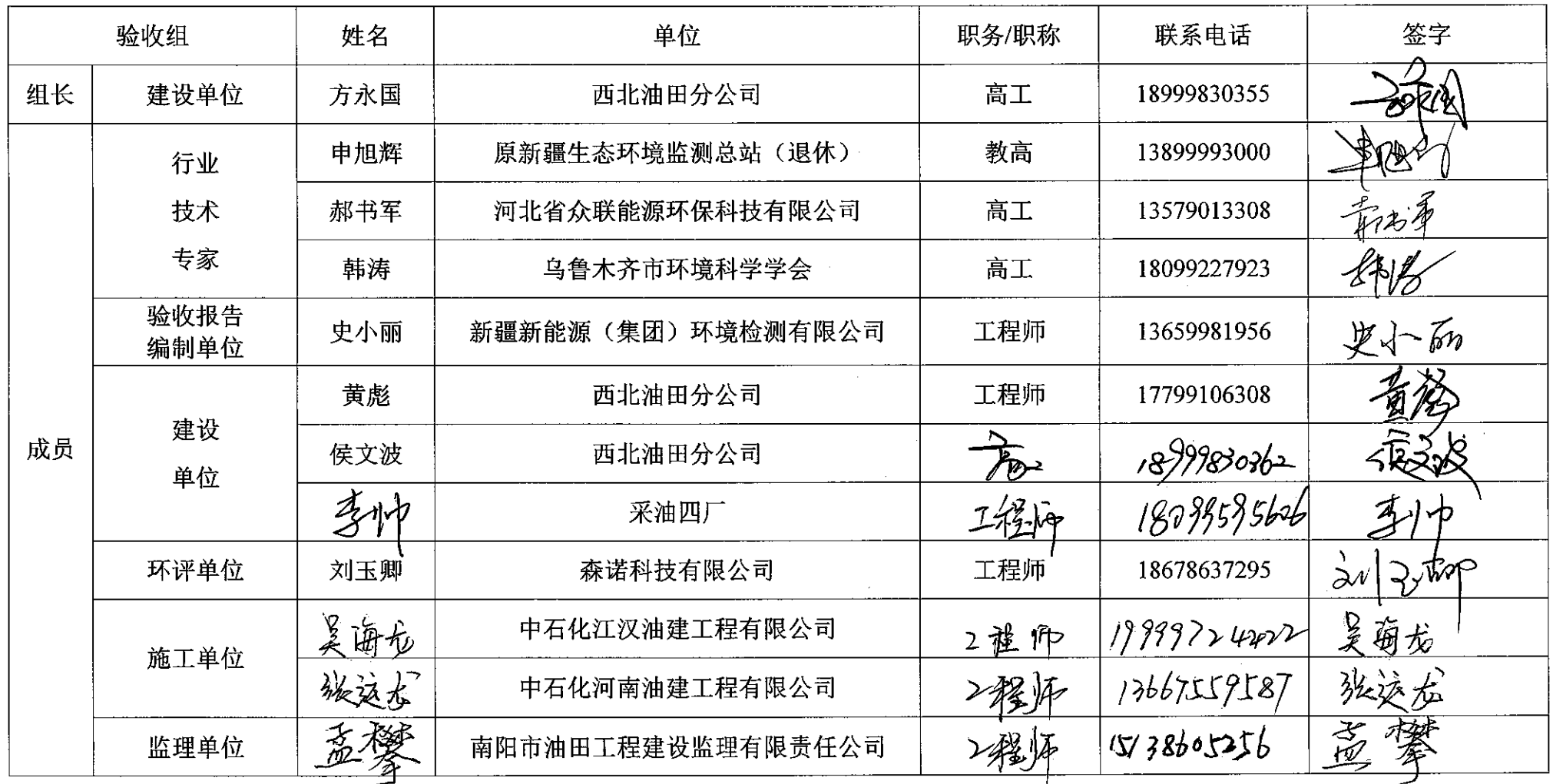
顺北油气田顺北二区至五号联络线工程竣工环境保护验收组名单